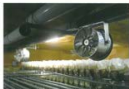
福岡県 きのこ菌床培養室

「風来望」は風に柔らかさを出す為に4枚羽根で設計しております。強風ではなく微風（0.5m/sec）がハウス内を大きく循環します。