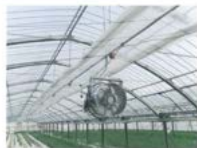
スライド式内張カーテン取付参考写真 Uボルト22.2φ用使用