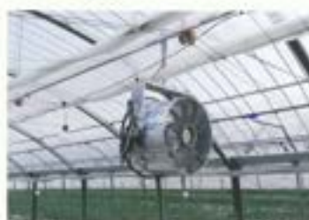
熊本県 トルコキキョウ