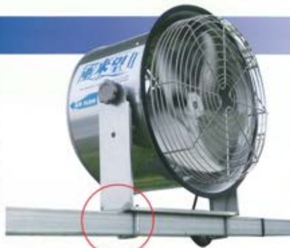
50角パイプ取付参考写真