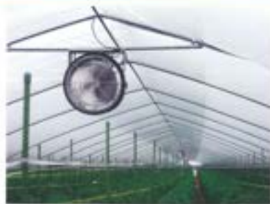
パイプ式内張カーテン取付参考写真 Uボルト22.2φ用使用